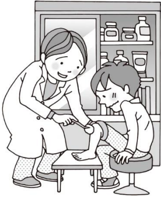
ケガの手当をします