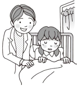
体調が悪いときに休めます