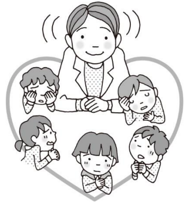
悩みを相談できます